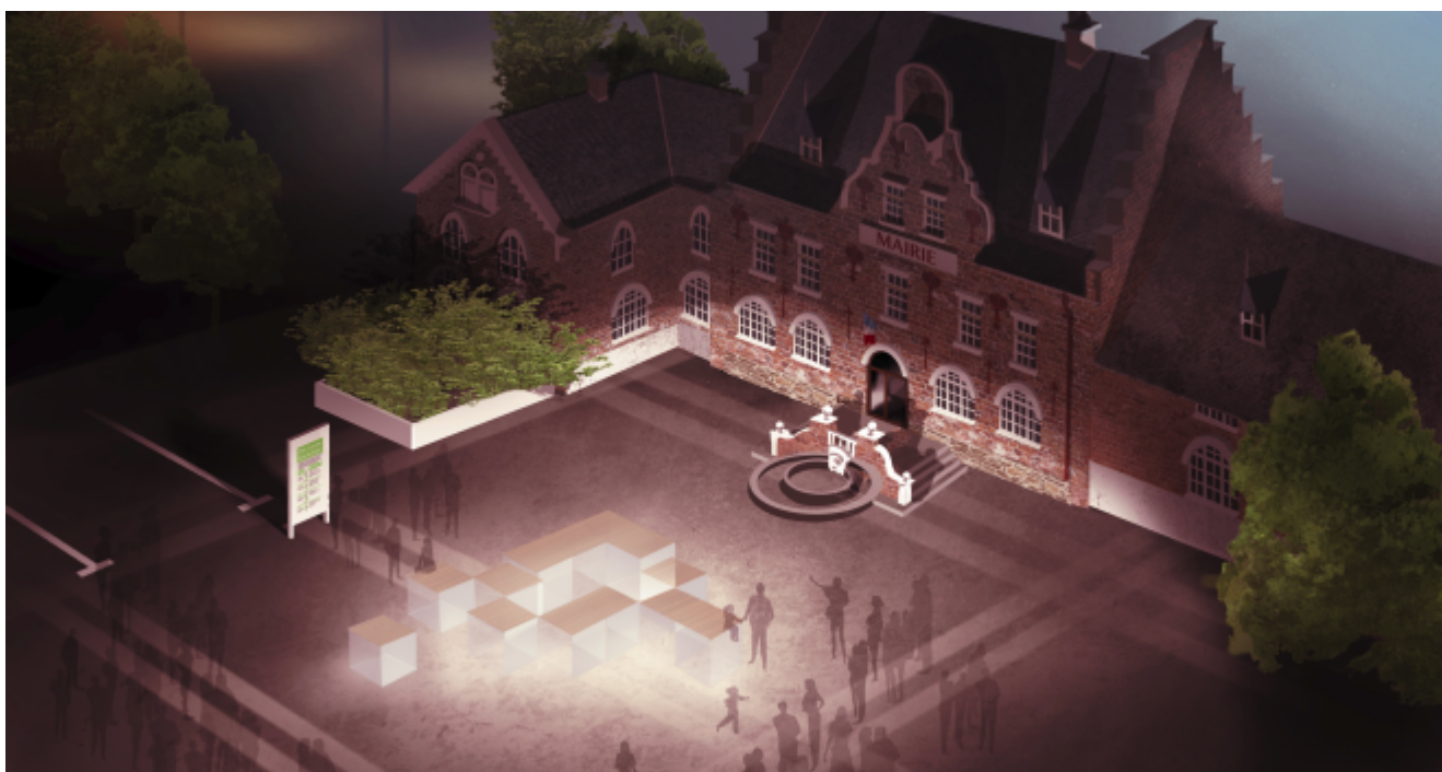
VOLUMES © Cerdd

Sur la base du travail de diagnostic, un événement public est organisé sur le territoire, dans l'espace public, afin de créer une dynamique autour des enjeux locaux d'adaptation. Ce temps fort s'appuie sur une installation pédagogique et artistique appelée « VOLUMES ».