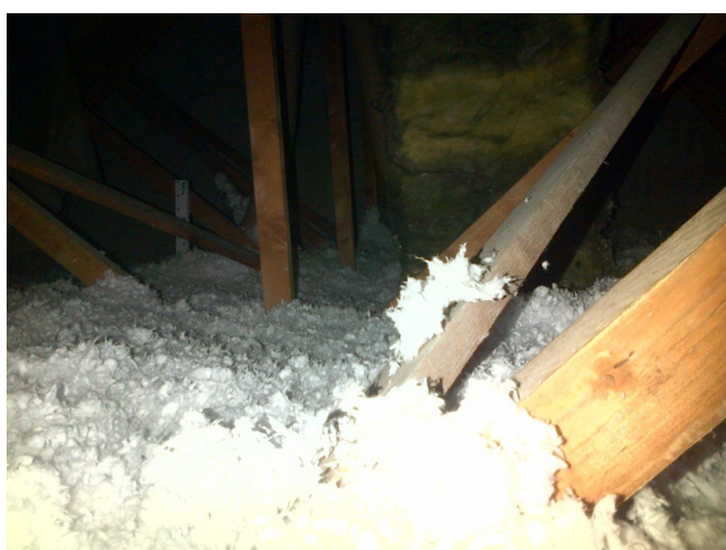
Chantier après intervention