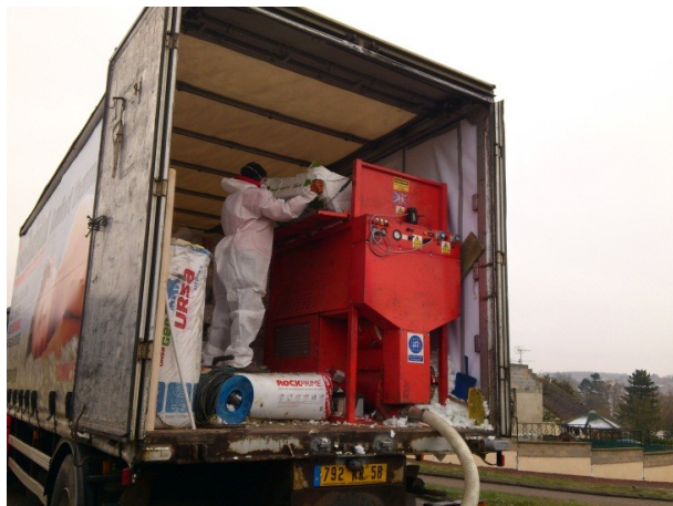
Cardeuse intégrée au camion, fonctionnant en totale autonomie