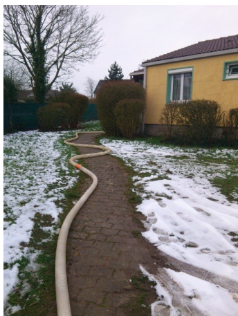
Tuyau de soufflage permettant de se positionner jusqu'à 200m du chantier