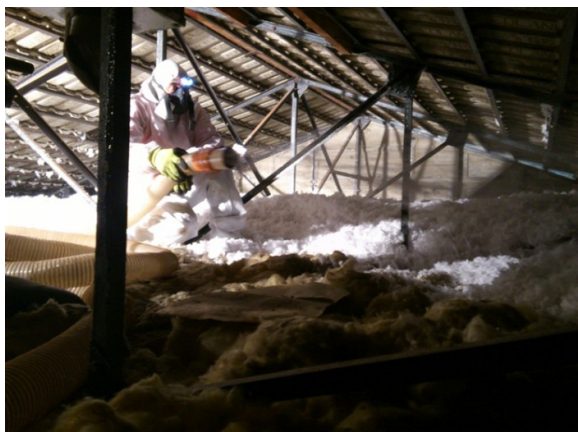
Réalisation du soufflage en moins d'une heure pour 70m 2