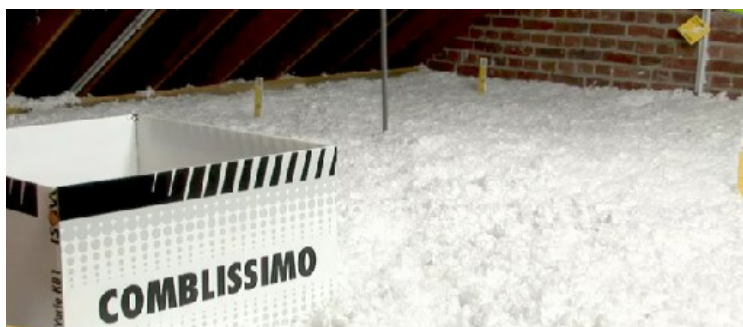
Matelas homogène, avec piges de mesure d'épaisseur Repérage des boîtiers électriques et réhausse de trappe électrique